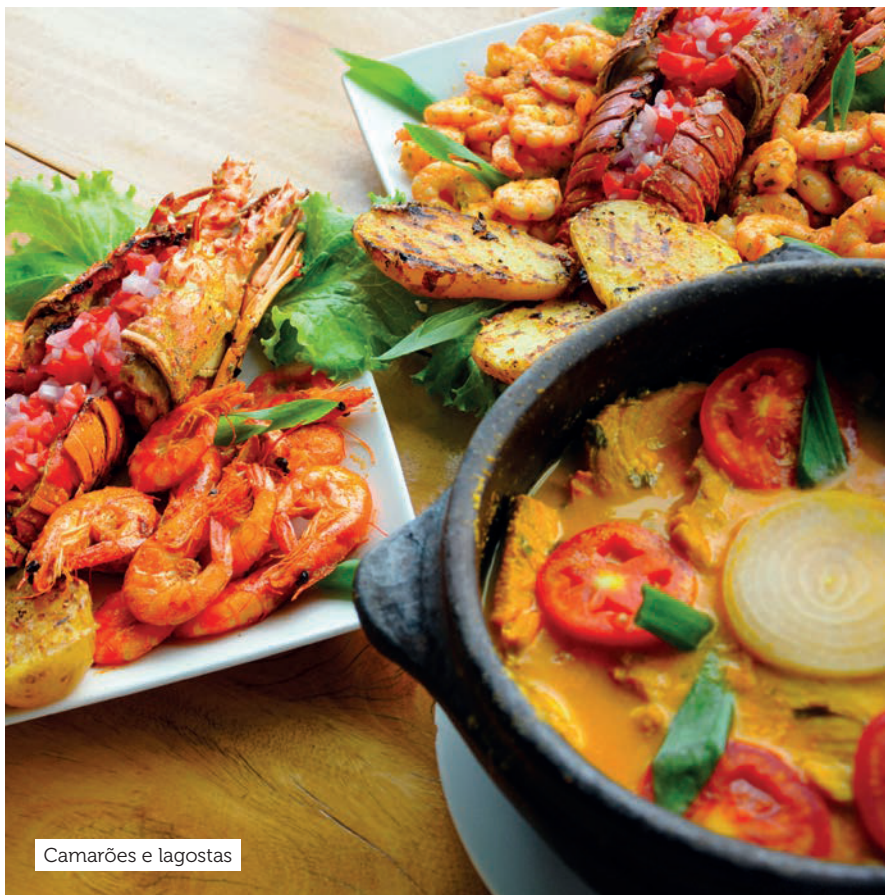
Camarões e lagostas

Endereço: Rua Francisco Gurgel, 47, Ponta Negra.