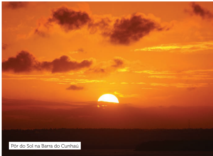
Pôr do Sol na Barra do Cunhaú