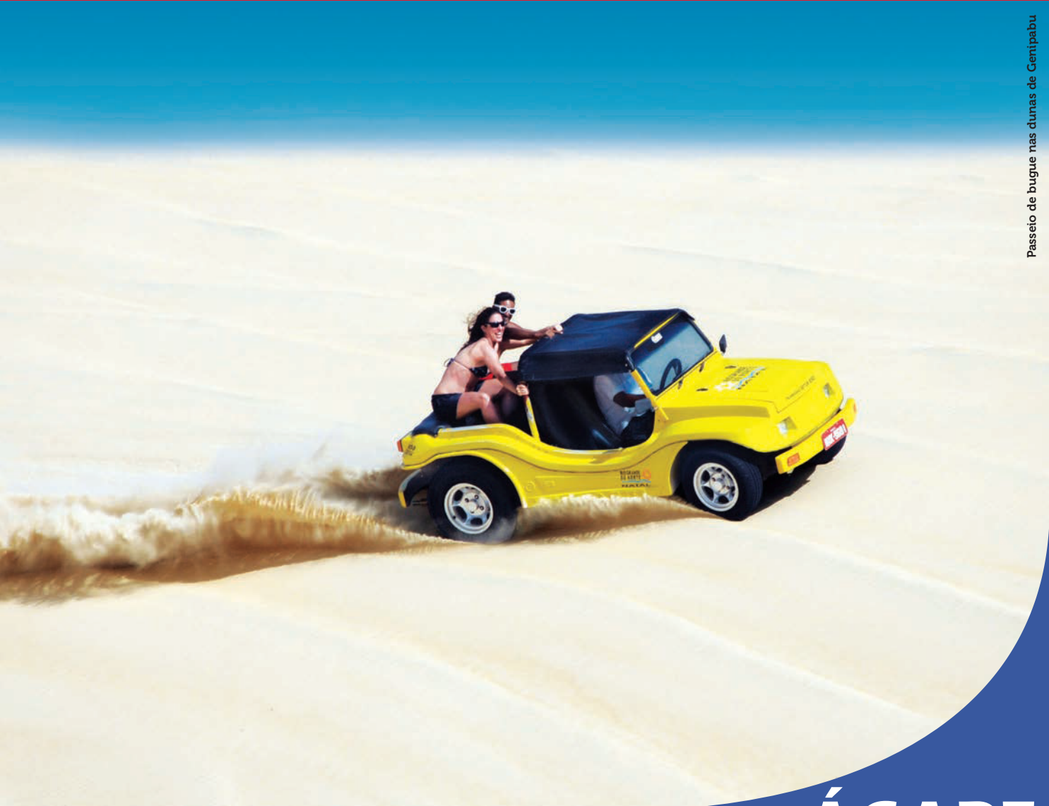
Passeio de bugue nas dunas de Genipabu