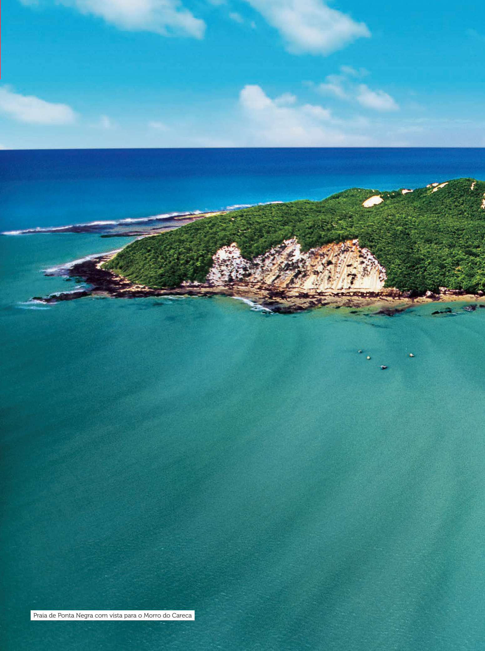
Praia de Ponta Negra com vista para o Morro do Careca