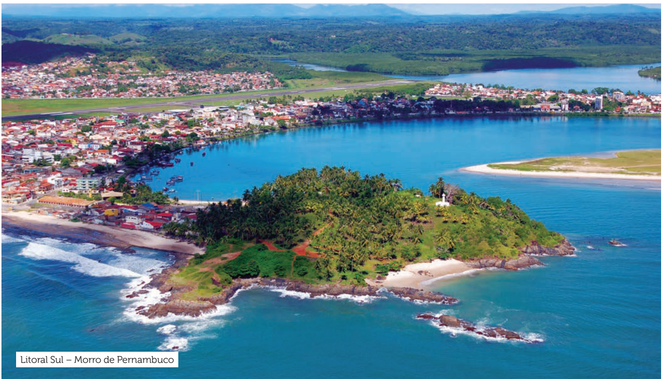
Litoral Sul – Morro de Pernambuco