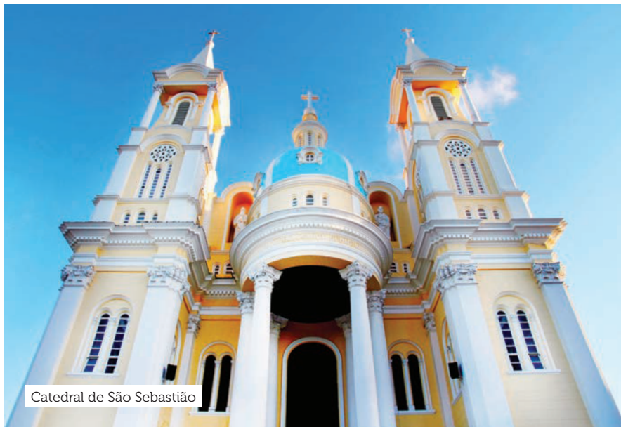
Catedral de São Sebastião