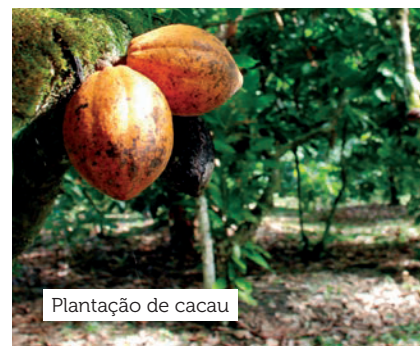
Plantação de cacau