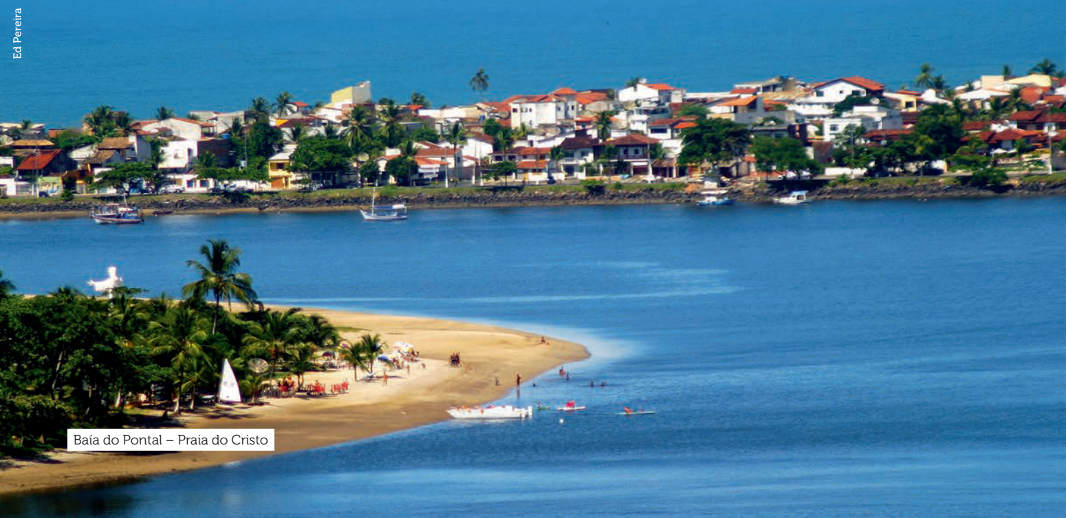
Baía do Pontal – Praia do Cristo

*Tempo estimado com base em voo direto, sem escalas ou conexões.