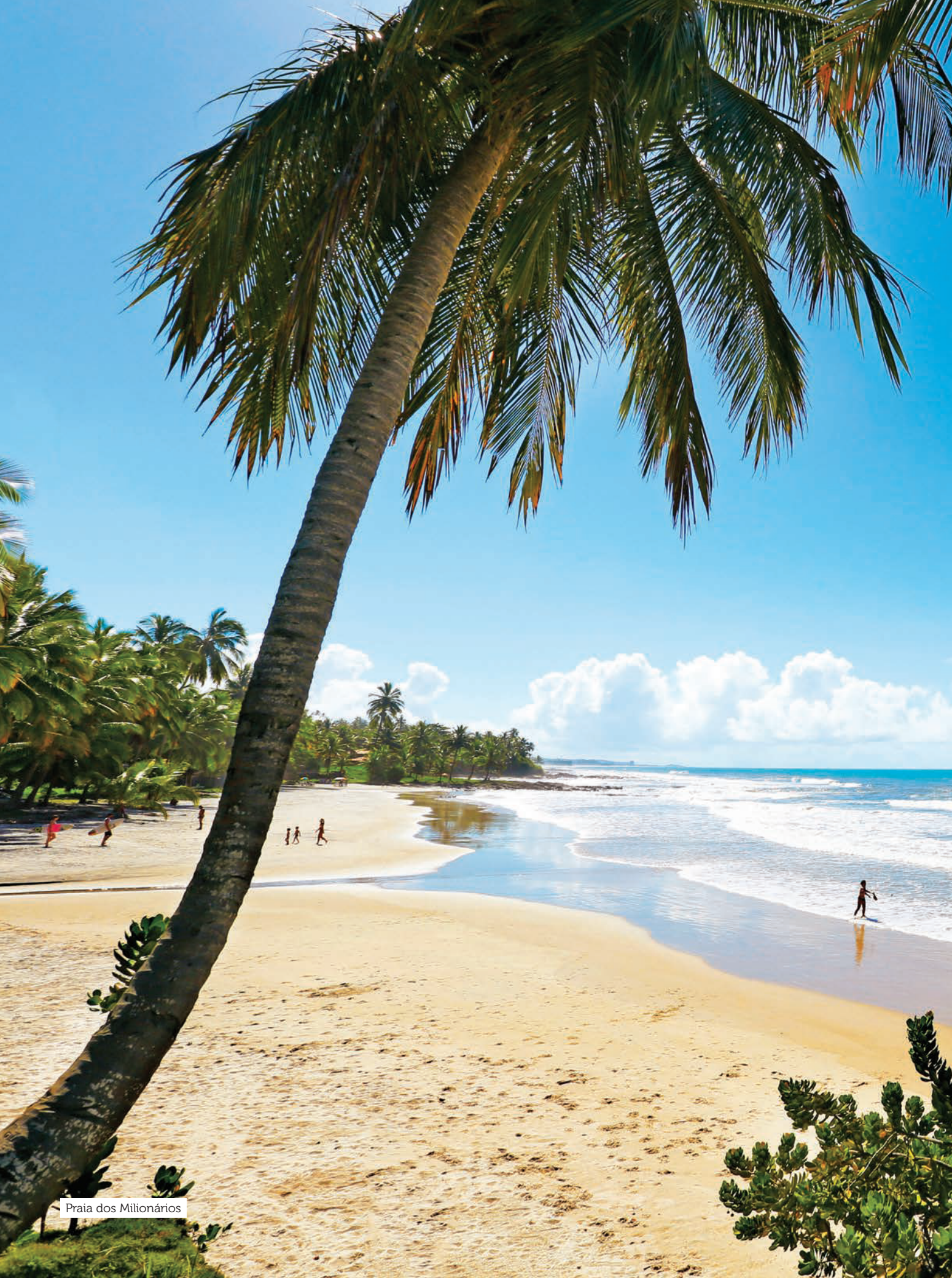
Praia dos Milionários