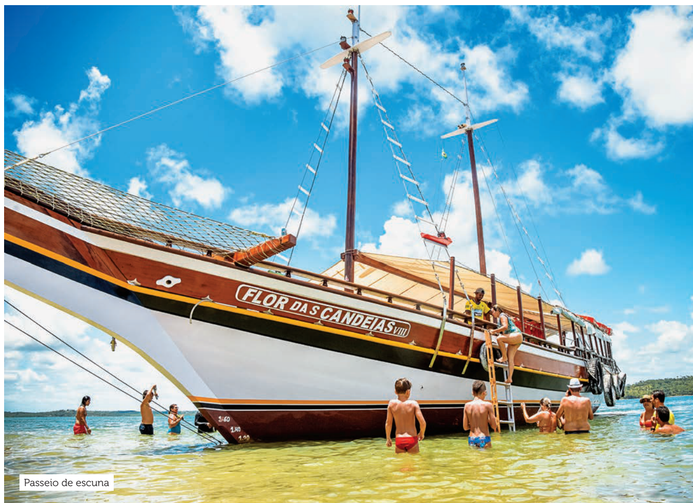
Passeio de escuna