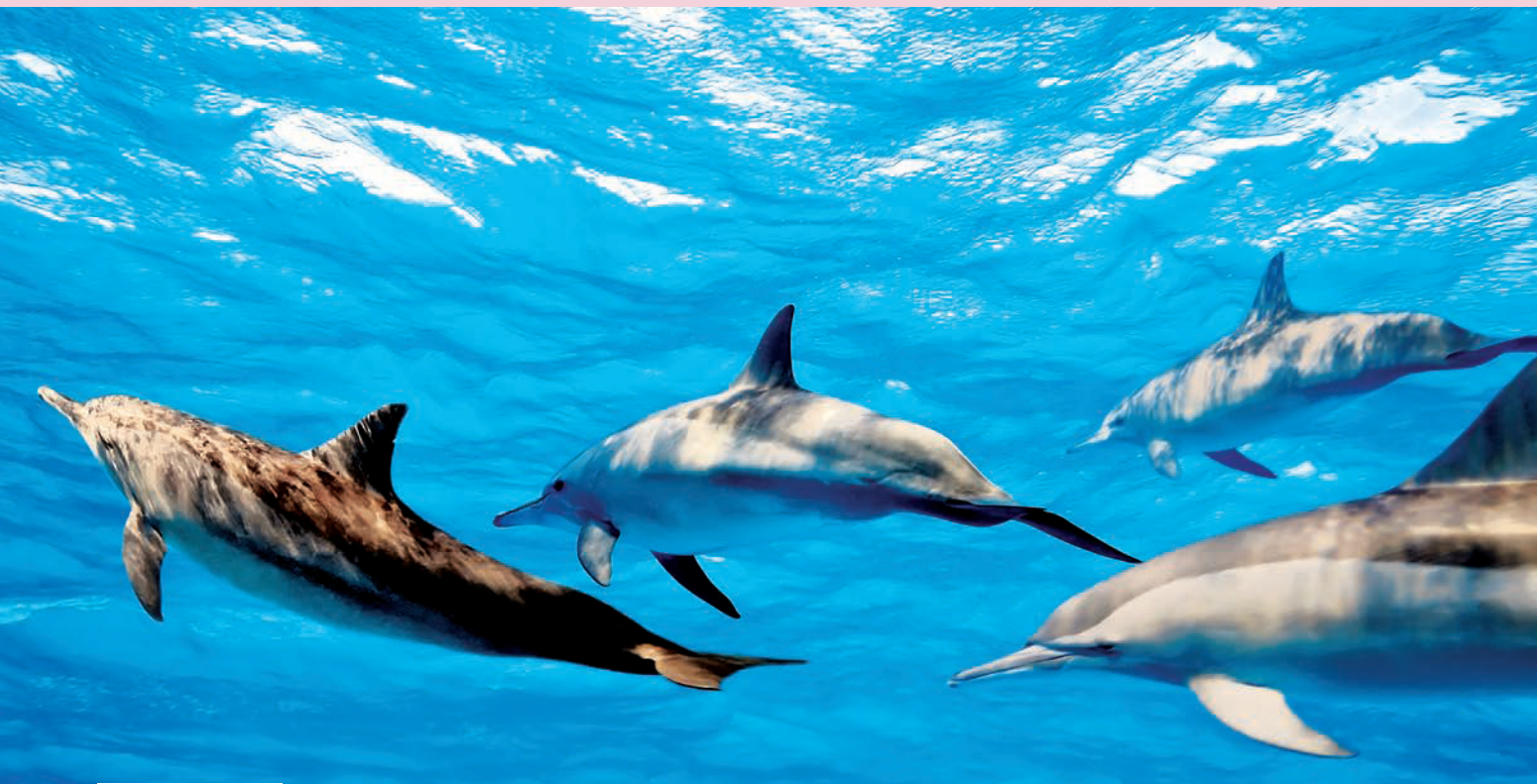
Baía dos Golfinhos

*Tempos com base em voos diretos, sem escalas ou conexões.