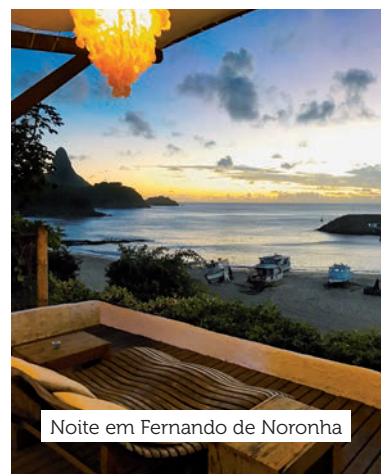
Noite em Fernando de Noronha