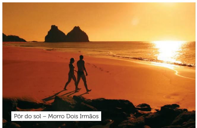
Pôr do sol – Morro Dois Irmãos