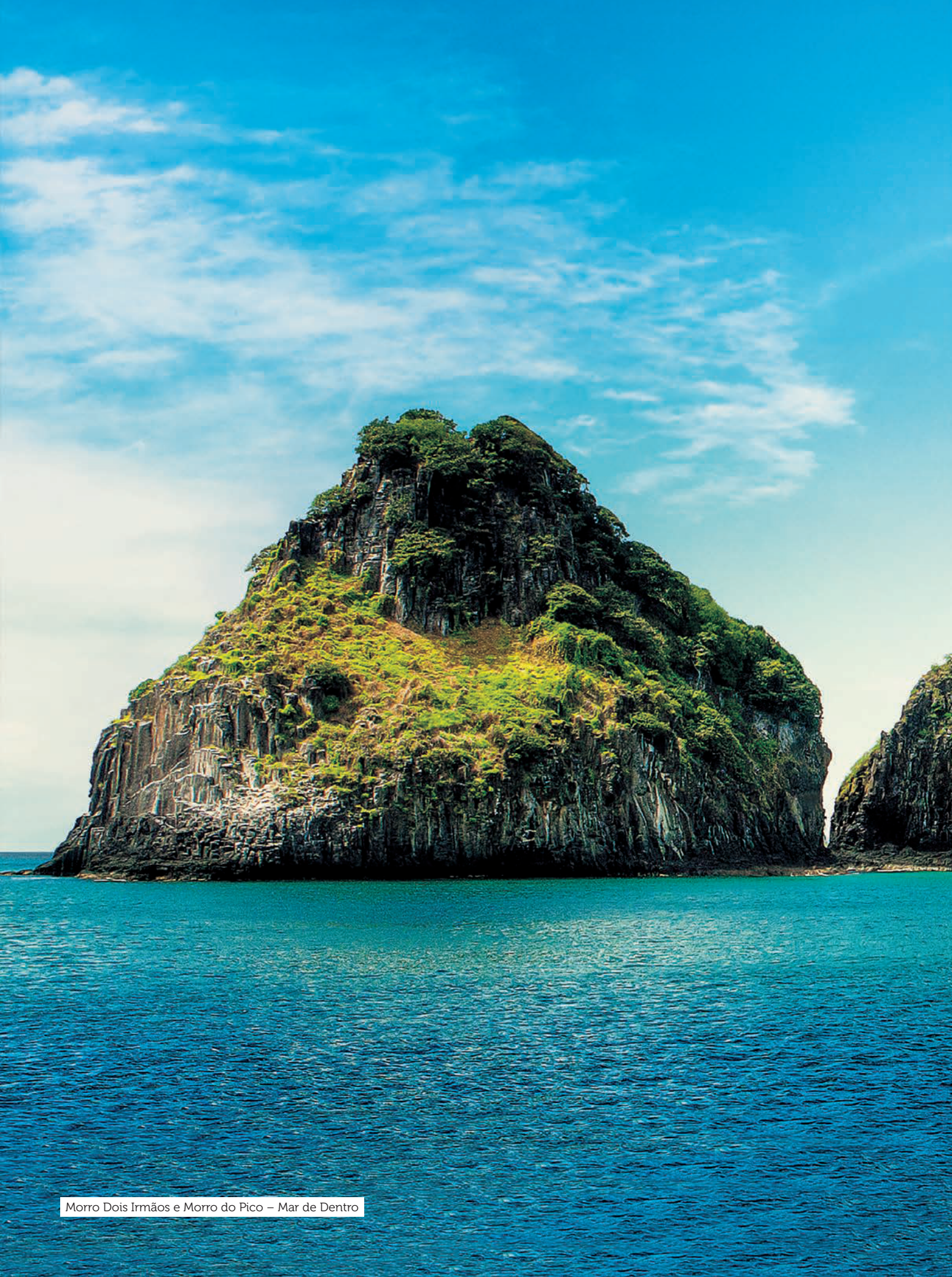
Morro Dois Irmãos e Morro do Pico – Mar de Dentro