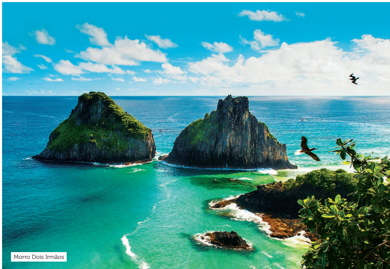
Morro Dois Irmãos

Esse museu expõe as arcadas dentárias de diversas espécies de tubarões e tem um restaurante. Em frente ao museu há um mirante de onde se vê o Buraco da Raquel, formação rochosa que é berçário natural de várias espécies marinhas.